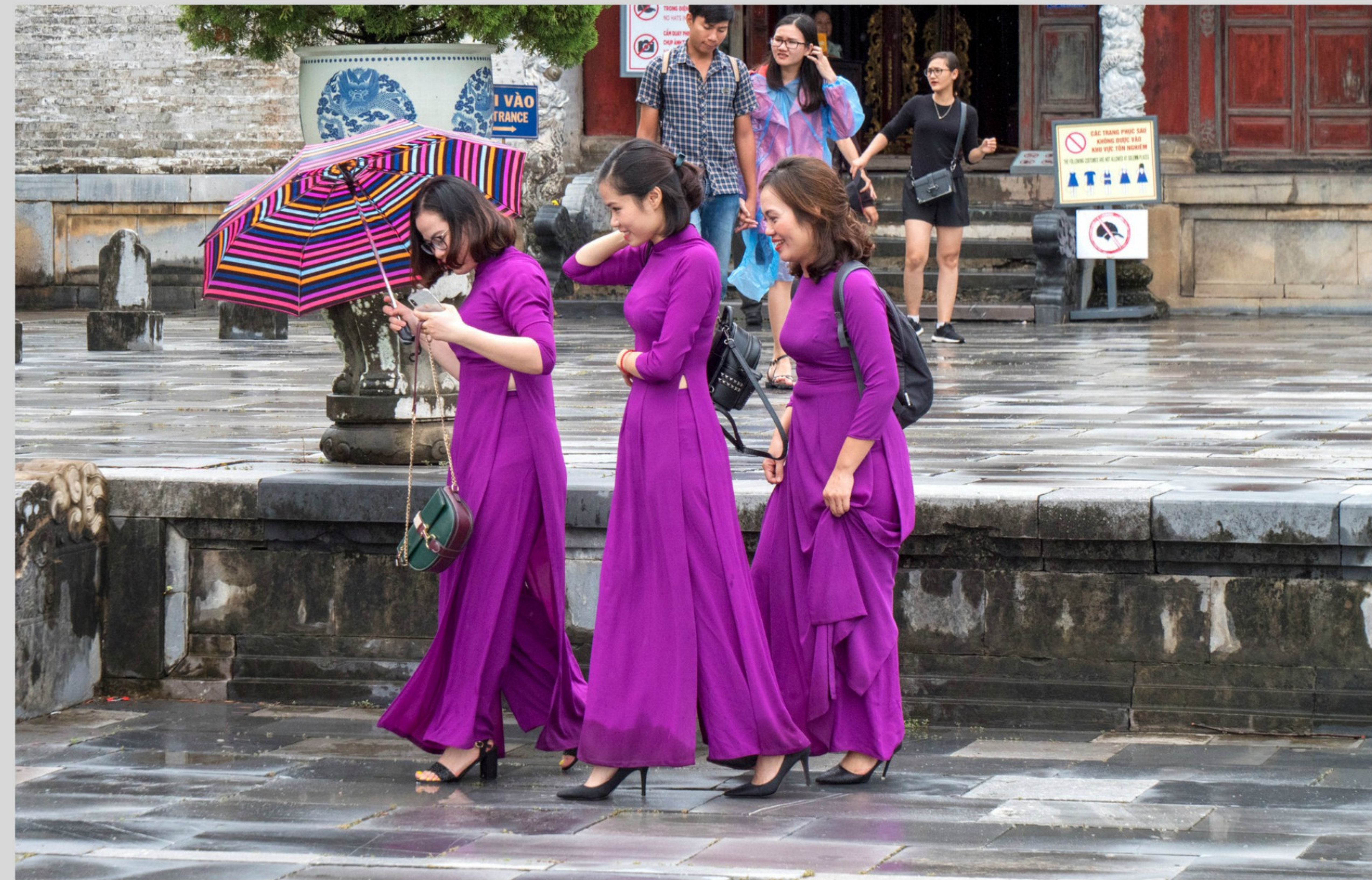
Im Museum ab fotografiert